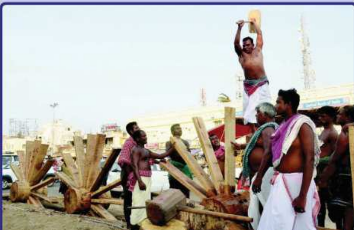
ଡା. ୨୧.୦୫.୧୯ରେ ମହାପ୍ରଭୁଙ୍କ ଚୂଳିତ ବର୍ଷର ରଥଯାତ୍ରା ନିମନ୍ତେ ରଥଖଳା ଠାରେ ରଥ ଚୂକର 'ସିଙ୍ଗଡ଼ା ବାଡ଼ିଆ' ଅନୁକୂଳ ହେଉଛି