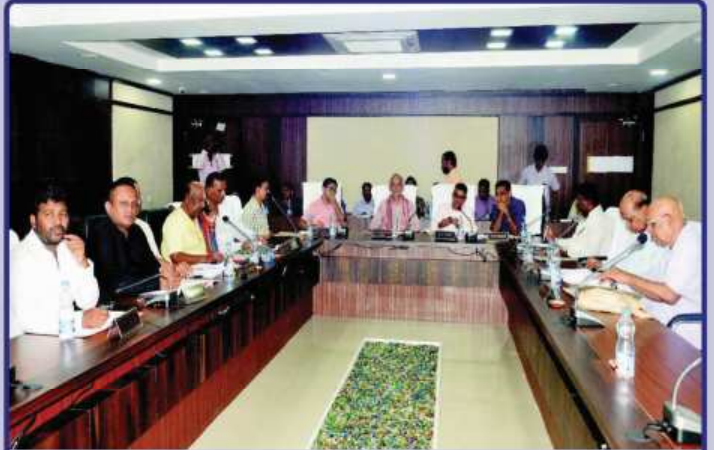
ତା. ୧୧.୦୬.୧୯ରେ ଶ୍ରୀମନ୍ଦିର ମୁଖ୍ୟ କାର୍ଯ୍ୟାଳୟ ଠାରେ ଗଜପତି ମହାରାଜା ଶ୍ରୀ ଦିବ୍ୟସିଂହ ଦେବଙ୍କ ଅଧିକ୍ଷତାରେ ଆହୂତ 'ଶ୍ରୀମନ୍ଦିର ପରିଷ୍କଳନା କମିଟି ବୈଠକ'