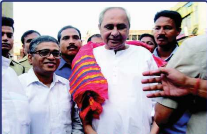
ତା. ୨୮.୦୫.୧୯ରେ ନୂତନ ମହାମଣ୍ଡଳ ଗଠନ ପୂର୍ବରୁ ଓଡ଼ିଶାର ମାନ୍ୟବର ମୁଖ୍ୟମନ୍ତ୍ରୀ ଶ୍ରୀଯୁକ୍ତ ନବୀନ ପଟ୍ଟନାୟକ ଶ୍ରୀମନ୍ଦିରରୁ ଶ୍ରୀବିଗ୍ରହମାନଙ୍କ ଦର୍ଶନ ସାରି ଫେରୁଛନ୍ତି