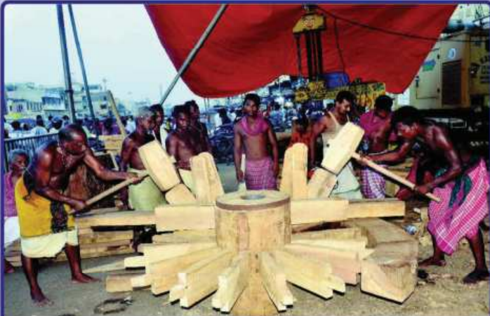
ତା. ୨୭.୦୫.୧୯ରେ ମହାପ୍ରଭୁଙ୍କ ବୃଲିତ ବର୍ଷ ରଥଯାତ୍ରା ନିମନ୍ତେ ରଥଖଳା ଠାରେ ରଥ ବୃକରେ 'ପଇ ବିନ୍ଧା' ଯାଉଛି