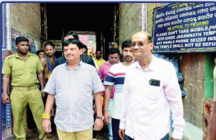
ତା. ୩୦.୦୫.୧୯ରେ ଓଡ଼ିଶାର ନୂତନ ଅର୍ଥ ଓ ଅବକାରୀ ମନ୍ତ୍ରୀ ଶ୍ରୀଯୁକ୍ତ ନିରଞ୍ଜନ ପୂଜାରୀ ଶ୍ରୀମନ୍ଦିରରୁ ଶ୍ରୀ ଚତୁର୍ଦ୍ଧାମୂର୍ତ୍ତିଙ୍କ ଦର୍ଶନ ସାରି ଫେରୁଛନ୍ତି