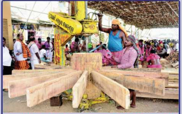
ଡା. ୨୨.୦୫.୧୯ରେ ମହାପ୍ରଭୁଙ୍କ ଚୂଳିତ ବର୍ଷର ରଥଯାତ୍ରା ନିମନ୍ତେ ରଥଖଳା ଠାରେ ପ୍ରସ୍ତୁତ ରଥ ଚୂକର 'ତୁୟରେ ବିନ୍ଧ' କରାଯାଉଅଛି