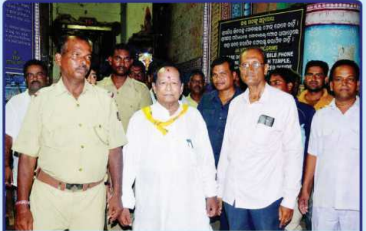
ତା. ୧.୦୬.୧୯ରେ ଓଡ଼ିଶା ବିଧାନ ସଭାର ନବନିଯୁକ୍ତ ବାଚସ୍ପତି ଶ୍ରୀଯୁକ୍ତ ସୂର୍ଯ୍ୟ ନାରାୟଣ ପାତ୍ର ଶ୍ରୀମନ୍ଦିରରୁ ଶ୍ରୀବିଗ୍ରହମାନଙ୍କ ଦର୍ଶନ ସାରି ଫେରୁଛନ୍ତି