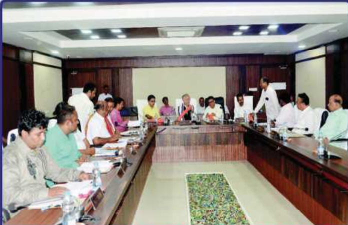
ଡା. ୨୧.୦୫.୧୯ରେ ଶ୍ରୀମନ୍ଦିର ମୁଖ୍ୟ କାର୍ଯ୍ୟାଳୟ ଠାରେ ଗଜପତି ମହାରାଜା ଶ୍ରୀ ଦିବ୍ୟସିଂହ ଦେବଙ୍କ ଅଧ୍ୟକ୍ଷତାରେ ଅନୁଷ୍ଠିତ 'ଶ୍ରୀମନ୍ଦିର ପରିଚଳନା କମିଟି ବୈଠକ'