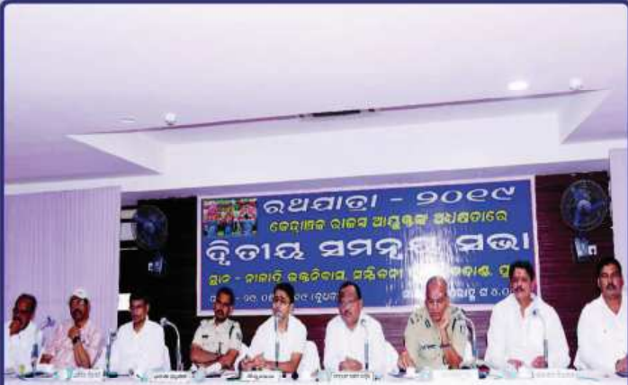
ତା. ୨୯.୦୫.୧୯ରେ ବଡ଼ବାଣସ୍ଥିତ ନାଳାଦ୍ରି ଭକ୍ତ ନିବାସ ସମ୍ମିଳନୀ କକ୍ଷ ଠାରେ କେନ୍ଦ୍ରାଞ୍ଚଳ ରାଜସ୍ୱ ଆୟୁକ୍ତ (R.D.C.) କ ଅଧିକ୍ଷତାରେ ଆହୂତ 'ରଥଯାତ୍ରାର ଦ୍ୱିତୀୟ ସମନ୍ୱୟ ବୈଠକ'