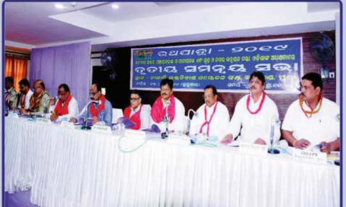
ତା. ୧୩.୦୬.୧୯ରେ ମାନ୍ୟବର ରାଜ୍ୟ ଆଇନ୍ ଓ ପଞ୍ଚାୟତରାଜ ମନ୍ତ୍ରୀ ଶ୍ରୀଯୁକ୍ତ ପ୍ରତାପ ଜେନାଙ୍କ ଅଧିକ୍ଷତାରେ ଆହୂତ 'ରଥଯାତ୍ରାର ତୃତୀୟ ସମନ୍ୱୟ ବୈଠକ'