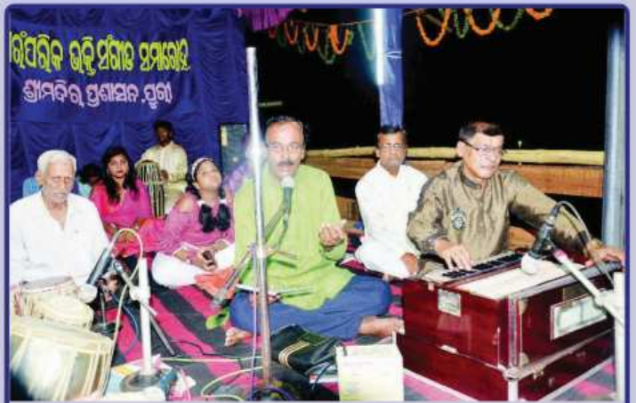
ମହାପ୍ରଭୁଙ୍କ ଚୂନନ ଯାତ୍ରା ପରିପ୍ରେକ୍ଷାରେ ନରେନ୍ଦ୍ର ଚୂକଡ଼ା ଠାରେ ଶ୍ରୀମନ୍ଦିର ପ୍ରଶାସନ ତରଫରୁ 'ପାରମ୍ପରିକ ଭଜନ' ପରିବେଷଣ କରାଯାଉଅଛି