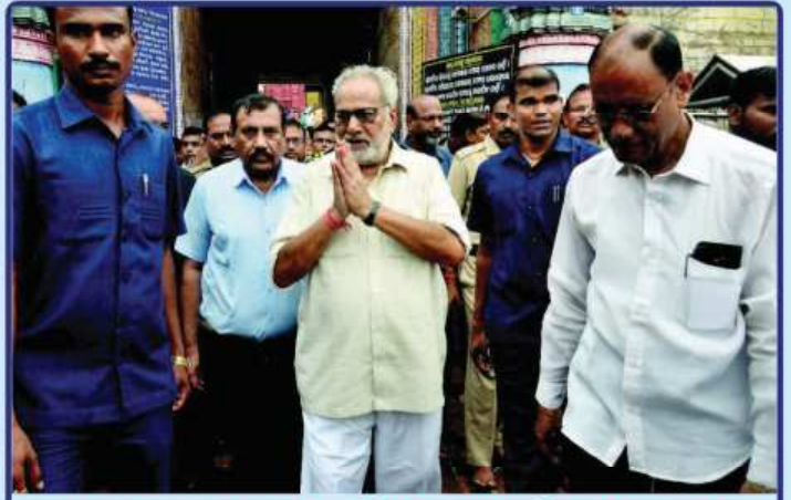
ତା. ୮.୦୬.୧୯ରେ ଓଡ଼ିଶାର ମହାମନ୍ତ୍ରୀ ରାଜ୍ୟପାଳ ପ୍ରଫେସର ଗଣେଶୀ ଲାଲ ଶ୍ରୀମନ୍ଦିରରୁ ଶ୍ରୀବିଗ୍ରହମାନଙ୍କ ଦର୍ଶନ ସାରି ଫେରୁଛନ୍ତି